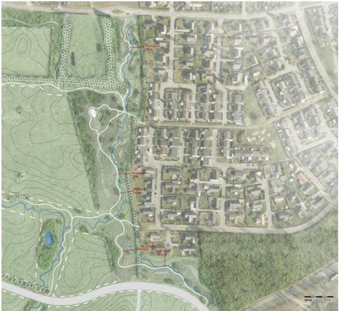
Oprindelig forslag til udformning af bakkelandskab