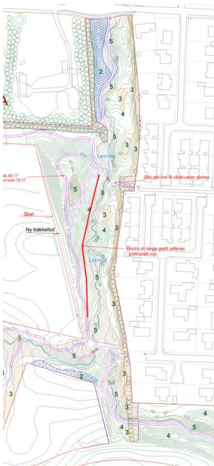
Nuværende situation med reguleringer og aftalte ændringer.